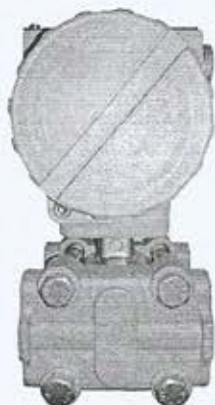
Рисунок - 3 Общий вид датчиков давления емкостных AMZ