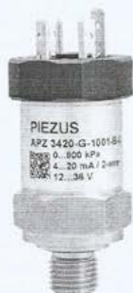
Рисунок 1 - Общий вид датчиков давления емкостных APZ