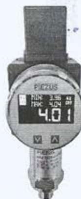
Рисунок -4 Общий вид датчиков давления емкостных ASZ