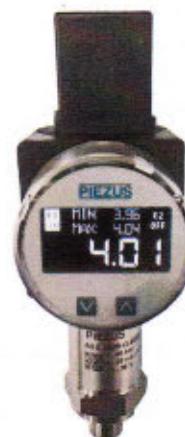
Рисунок 4 - Общий вид датчиков давления тензорезистивных ASZ