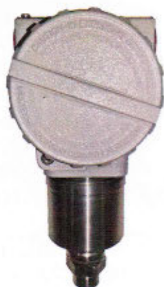
Рисунок 3 - Общий вид датчиков давления тензорезистивных AMZ