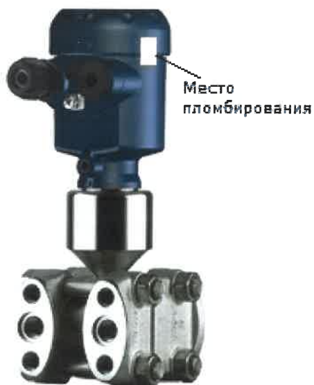
Рисунок 7 - Место пломбирования преобразователей разности давлений DPT-10

Варианты пломбирования преобразователей представлены на рисунках 7-9.