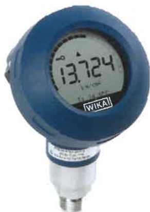
Рисунок 5 - Общий вид преобразователей давления UPT-20 (с присоединительным штуцером, пластиковый корпус)