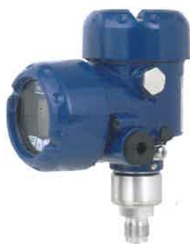
Рисунок 3 - Общий вид преобразователей давления IPT-10 (стандартное исполнение, пластиковый корпус)