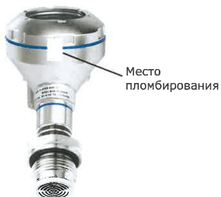
Рисунок 9 - Место пломбирования преобразователей давлений UPT-20, IPT-21