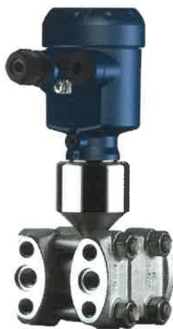
Рисунок 1 - Общий вид преобразователей разности давлений DPT-10 (исполнение с однокамерным корпусом)

Фотографии общего вида преобразователей представлены на рисунках 1-6.