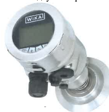
Рисунок 4 - Общий вид преобразователей давления IPT-11 (исполнение с фронтальной мембраной, стальной корпус с электрополировкой)