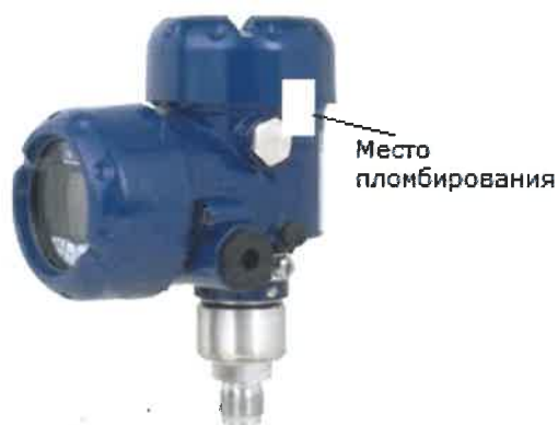
Рисунок 8 - Место пломбирования преобразователей давлений IPT-10, IPT-11