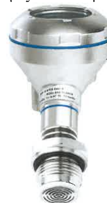
Рисунок 6 - Общий вид преобразователей давления UPT-21 (с плоской мембраной, стальной корпус)