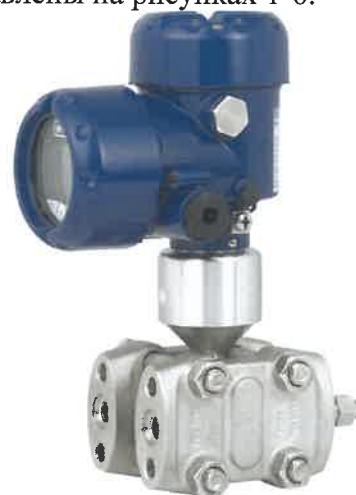
Рисунок 2 - Общий вид преобразователей разности давлений DPT-10 (исполнение с двухкамерным корпусом)