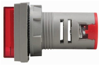
Рис. 2 – Вид сбоку Omix T33-M3-1