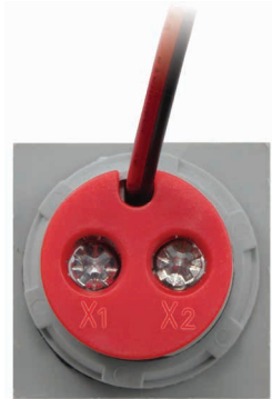
Рис. 3 – Вид сзади Omix T33-M3-1