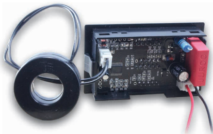
Рис. 1 – Задняя панель

Разъем Зрп для входного сигнала и питания