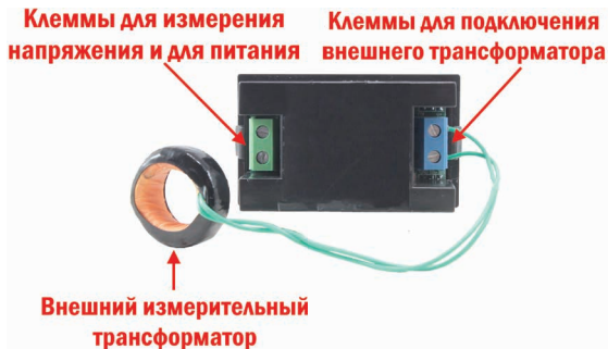
Рис. 1 – Задняя панель

После включения питания прибор сразу перейдет в режим измерения напряжения и силы тока.