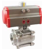
КПП-3-050 с ППР2-063