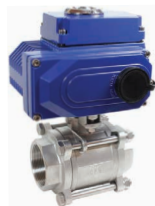
КПП-3-050 с ЭПР1-008