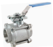
КПП-3-050 с ручкой