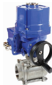
КПП-3-050 с ЭПР4-010